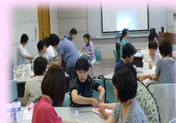
ボランティア研修(ハンドマッサージ)

べにっこひろば(山形市)、げんキッズ(天童市)、やまがた健康フェア、福島県外避難者心のケアでの「まちの保健室」など多くの場所で活動しています。