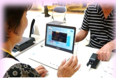
血管年齢測定の様子