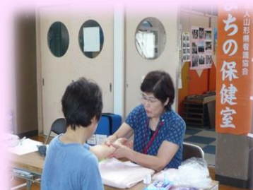
ハンドマッサージの様子