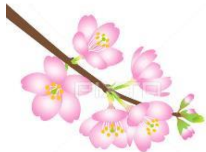
町民の花 オオヤマザクラ